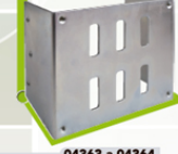
04363 a 04364