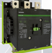
04098 a 04124 225 - 500A (AC3)