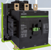
04080 a 04094 115 - 185A (AC3)