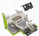
04170 a 04176 12 - 38A