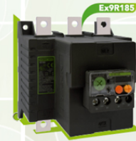
04330 a 04334