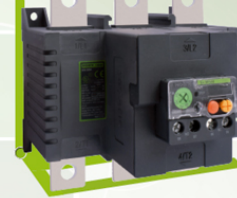
04336 a 04342