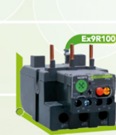
04318 a 04328