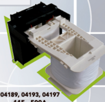
04189, 04193, 04197 115 - 500A